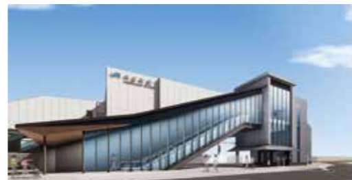
▲西口駅前広場からの外観 ※パースはイメージであり、今後変更になる場合があります。