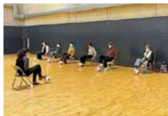
▲向日市での開催の様子

健康アカデミー 運動を通じて、健康であることの楽しさを実感するとともに、生涯健康に過ごせる社会づくりを推進していくため、高齢者などを対象に健康体操教室を開催しています。ほかにもさまざまな活動を実施していますので、詳しくはホームページ(☎https://www.sanga-fc.jp/news/p/16869/)をご覧ください。